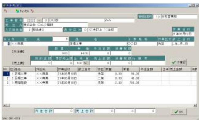
<外注売上計上処理>