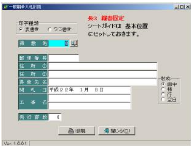
<一般競争入札封筒印刷>